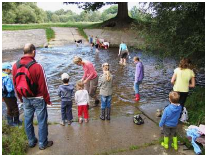
Výprava k Tůním u Špačků