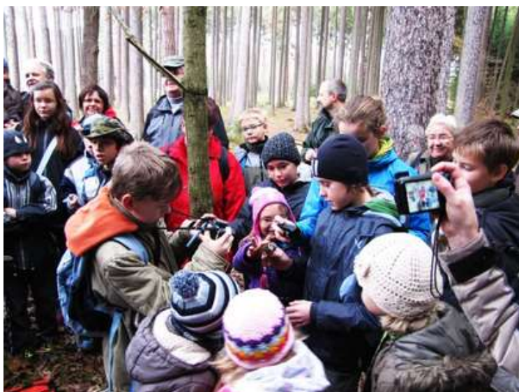
Krmítka v Branišovském lese