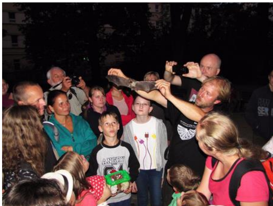
Netopýří safari v parku Na Sadech