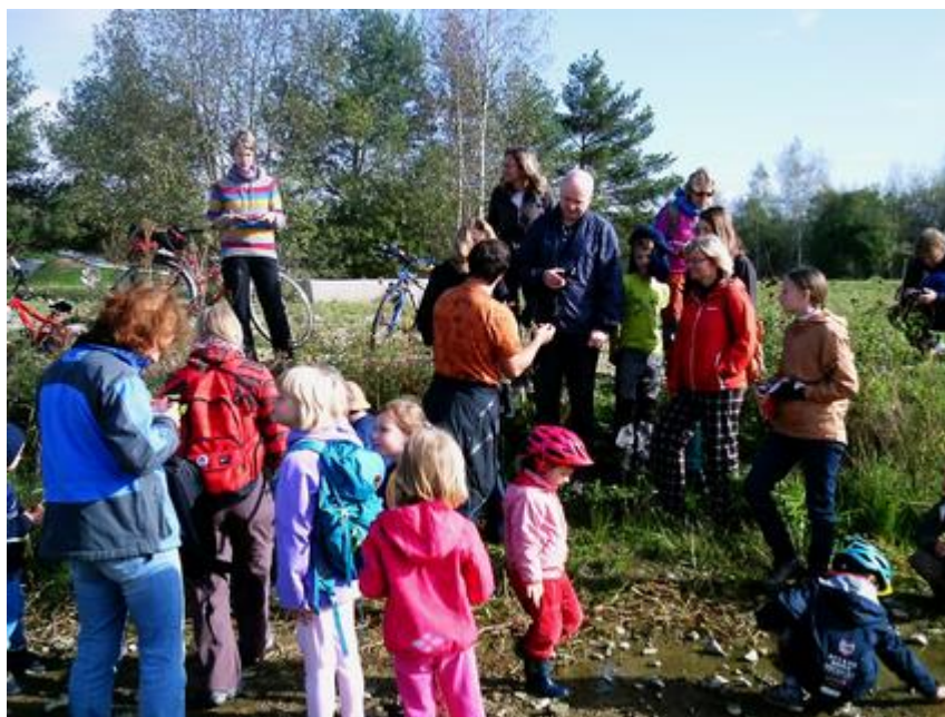
Za rostlinami a hmyzem do parku 4Dvory