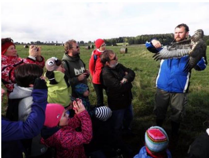
Kroužkování na polích u Kaliště