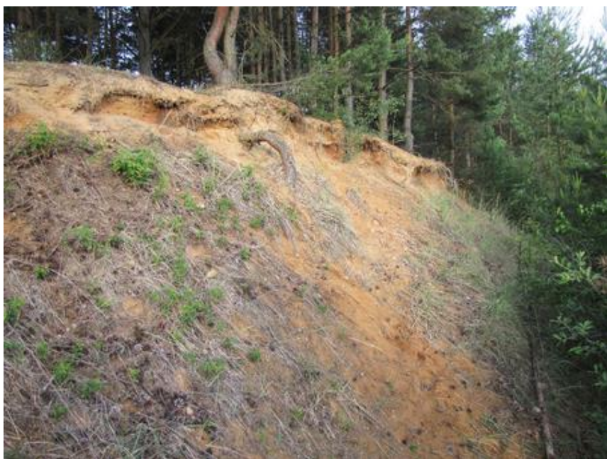
Plocha s cachí na konci sezony