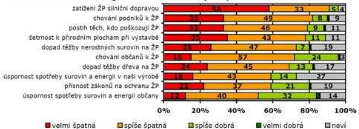
Graf : Hodnocení ekologické situace v ČR (v %)

pralesů (89 %), úbytek druhů (83 %) a vyčerpání surovin (rovněž 83 %). Globální oteplování jako závažný problém vnímá 80 % Čechů. Avšak co se týče GMO, je to jen 46 % (proti 30 %, která problém nevidí, resp. jej považují za málo závažný). Počet respondentů negativně hodnotících fungování jaderných elektráren poklesl od roku 2006 z 53 na dnešních 43 % (oproti 44 % vnímajících je dnes spíše pozitivně).