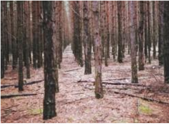
Bezútěšná borová monokultura u Bzence.