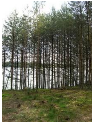
Les neboli plantáž na dřevo Cep.