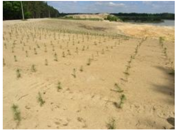
Takto začíná Cep na Třeboňsku.