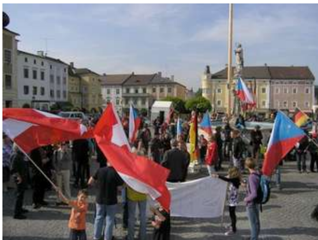
Freistadt, 14. května