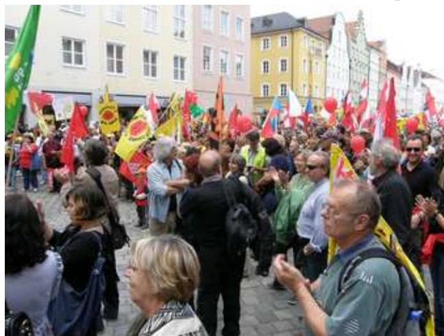
Landshut, 28. května