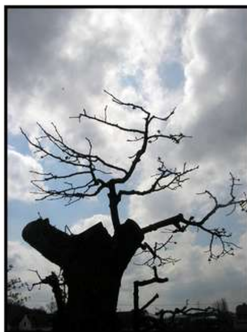
Vladana Švehlová – Zajímavé torzo stromu na hrázi rybníka Svět