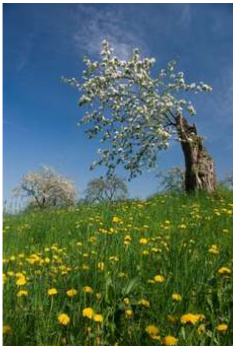
Jan Husák - Z torza staré třešně se zrodil nový výhonek (Střítež nad Bečvou)