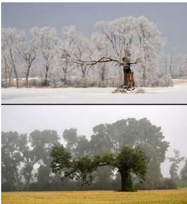
Eva Stanovská - Strom - od zimy do léta