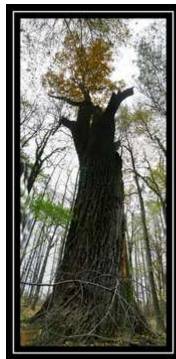
Čestmír Černošek - Velikán