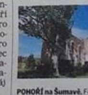
POHORÍ na Šumavě. F...

„Z Rybníka přes Dolní Dvořiště nad Malší, Svaty Ká... viny, Leopoldov do Šumavě,“ udává tra... kilometrové poutě... keš a připojuje i... „Občas nás potká... důležitá rozhodnutí... další život zásadně... dobré se za tyto kr... a obětovat fyzicko... Vrcholem je mše n... tela Panny Marie, ...ré rady,“ dodává... hlásky přijímá do... mail: krikjp@gmail