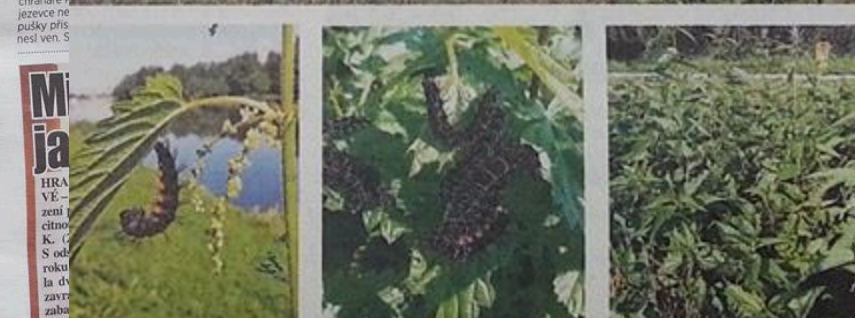
RÍVOVÁ SPÁSA. Pruhy kopřiv spásají housenky baboček paví oka.

...který spolufinancuje také magistrát města České Budějovice, je propagovat jednoduché možnosti jak pomocí motýlům a zajištění péče o vybrané lokality v Českých Budějovicích.