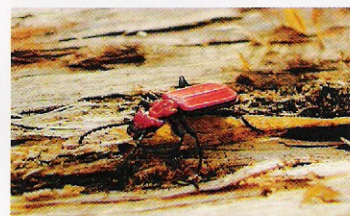
Lesák rumělkový ( Coccinella cinnabarinus )

Na kmenech se sluní a vyhřívá spousta druhů lihnoucích se motýlů, přímo na