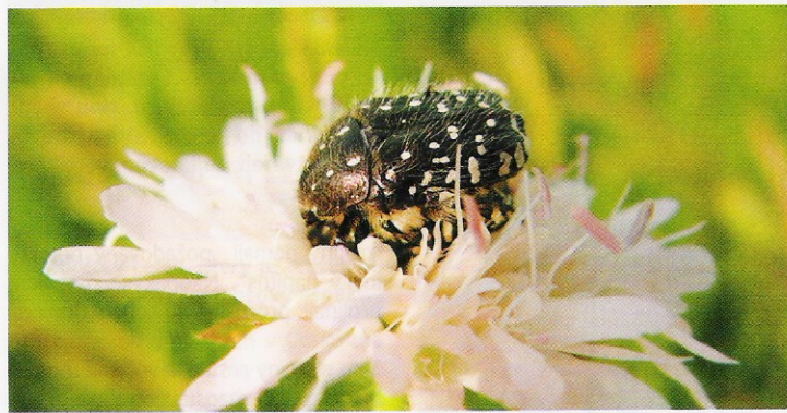
Zlatohlávek ( Oxythyrea funesta )

Velmi zajímavou složkou ovocných sadů jsou květnaté louky. Pokud jsou šetrně koseny, mohou hostit ještě bohatší společenstva hmyzu než dřeviny samotné. Šetrným kosením se rozumí takové, kdy sad není pokosen nikdy celý, vždy zůstává mozaika pokosené a nepokosené louky, jako tomu bylo za našich předků. Je poměrně logické, že