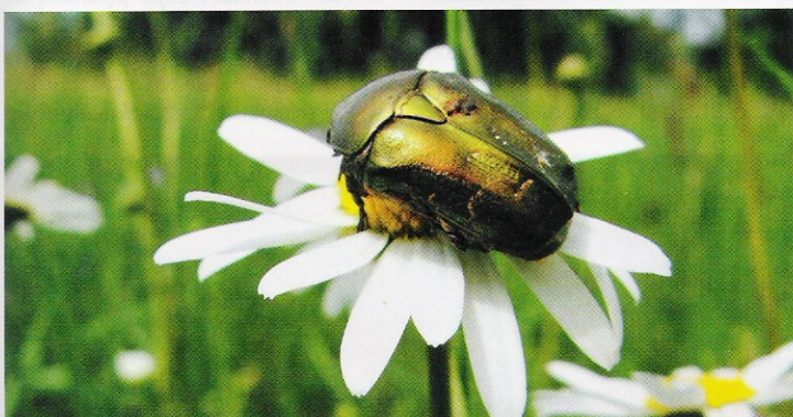
Zlatohlávek mramorovaný ( Liocola lugubris )

Vysvětlivky: Stupeň ochrany podle vyhlášky: KO – kriticky ohrožený druh, SO – silně ohrožený druh, O – ohrožený druh Stupeň ochrany podle ČS: RE – pro území ČR vymizelý druh, CR – kriticky ohrožený druh, EN – ohrožený druh, VU – zranitelný druh, NT – téměř ohrožený druh * Druh chráněný celoevropsky v soustavě Natura 2000