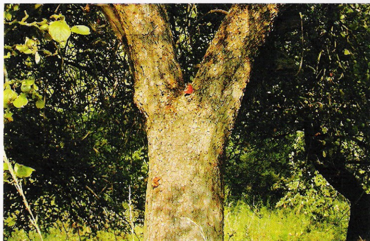
Na kmenech se sluní a vyhřívá spousta druhů lihnoucích se motýlů, přímo na borce či v jejich záhybech lze nalézt jejich kukly, po borce pobíhají mravenci a draví střevlíci

stává, že naše původní druhy jableň a hrušně je v přírodě velmi obtížné najít, daleko více je kříženců právě s tzv. kulturními druhy.