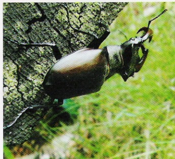
Roháč obecný ( Lucanus cervus )

Svůj význam má i tzv. šetrné kosení, kdy sad není pokosen nikdy celý, ale vždy zůstává mozaika pokosené a nepokosené louky, jako tomu bylo za našich předků